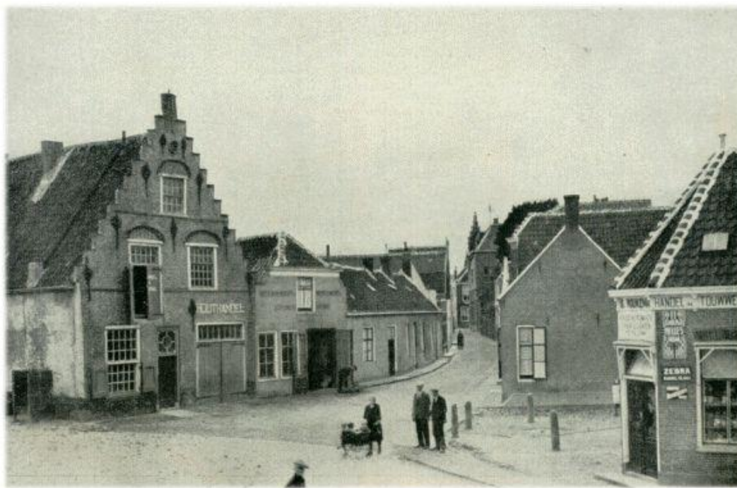
Foto voor 1940. De Visstraat te Tholen, links een houthandel en smidse, rechts een winkel voor scheepsbenodigdheden en in het midden het visperk.