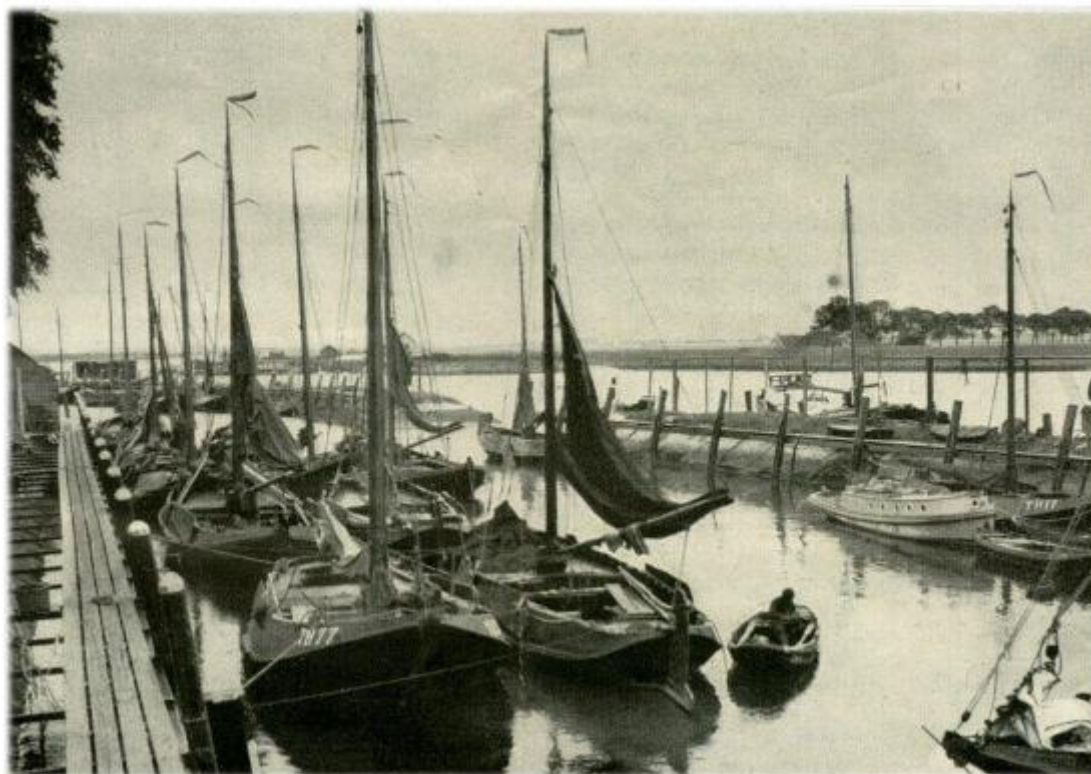
Foto voor 1928. Vissersboten in de haven van Tholen.